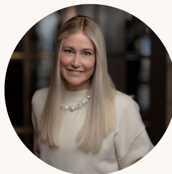
Förvaltare D&G Resilient World Small Cap A